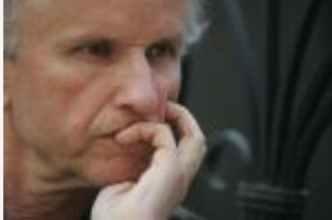
autor zdjęcia: Seweryn Sołtys źródło: Fotorzepa Grzegorz W. Kolodko

Dochód 50 tysięcy złotych rocznie to zupełnie co innego, gdy pracuje się nań osiem, a co innego, gdy tyra się dziesięć godzin dziennie. Te same pieniądze mają dla nas inne znaczenie, gdy wokół jest czysto i schludnie, a inne, gdy brudno i niechlujnie – pisze ekonomista