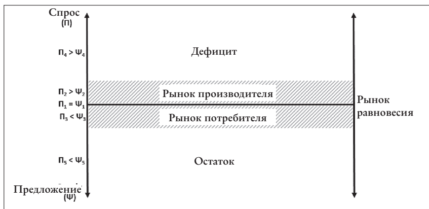
Рис. 1. Рынок производителя (с дефицитами) по сравнению с рынком покупателя (с излишками)

Поэтому, когда в первой половине 70-х годов мы поехали из Варшавы в Будапешт, то считали – и не без оснований, – что там ситуация лучше. Однако, когда кто-то из нас не нашел джинсы нужного размера и должен был натягивать джинсы на размер меньше, а вместо желаемого долгоиграющего диска Led Zepplin кто-то вышел из магазина на улице Ленина с диском группы Procol Harum, мы поняли, что дефициты есть и там. Конечно, в менее заметных сегментах рынка – например, на рынках жилья, автомобилей, телефонов, иностранной валюты для поездок за границу – дефициты были еще большими. Как бы то ни было, в Венгрии уровень дефицитов был относительно низким. Интересно, что при этом автор теории экономики дефицитов именно венгерский экономист, хотя у румын и болгар, русских и украинцев, словаков и чехов, безусловно, было больше возможностей для соответствующих наблюдений.